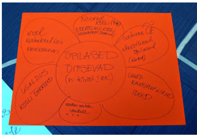
Kiviõli I Keskkooli edulugu.