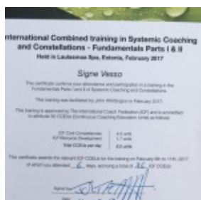
Signe Vesso Systemic Coaching and Constellations