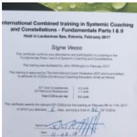
Signe Vesso Systemic Coaching and Constellations