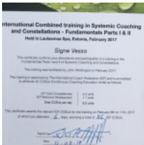
Signe Vesso Systemic Coaching and Constellations