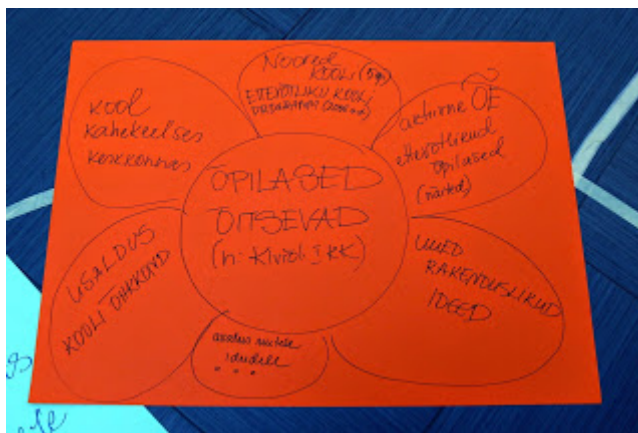
Kiviõli I Keskkooli edulugu.