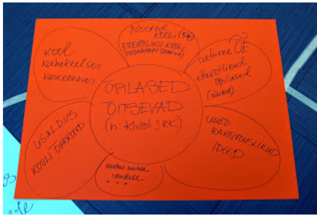
Kiviõli I Keskkooli edulugu.