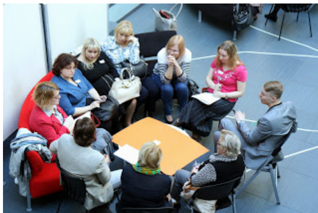
Õpetajate arutelurühm 2. supervisioonipäeval.

Milleks supervisioonipäev? Supervisioonipäeval osalenud kogesid, kuidas supervisiooni ja coachingu meetodid toetavad tegevuste eesmärgistamist ja probleemide lahendamist ning teadlikku ja koostöist arutelu. Seekordne kohtumine polnud aga sugugi esimene – möödunud aasta oktoobris toimus 1. supervisioonipäev, kus toimusid töötoad ja töötati välja tegevuskavad. Alates sellest ajast on koos käinud ka pilootgrupid, kus on toimunud nii koolijuhtide supervisioon kui ka koolide meeskondade toetamine eesmärkide saavutamiseks.