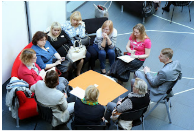
Õpetajate arutelurühm 2. supervisioonipäeval.