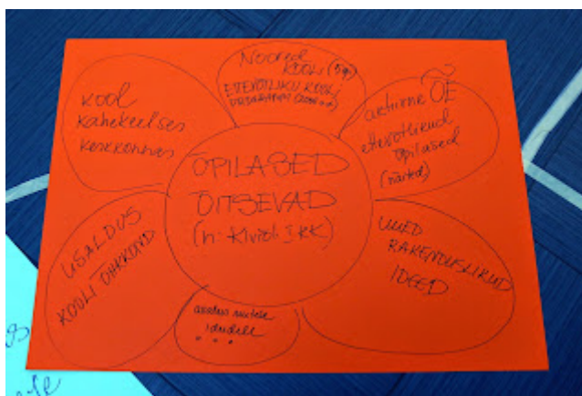
Kiviõli I Keskkooli edulugu.